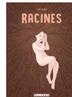
RACINES Lou Lubie | BD