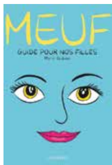
MEUF : GUIDE POUR NOS FILLES Marie Dubois | BD