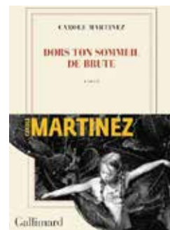
DORS TON SOMMEIL DE BRUTE Carole Martinez | Roman