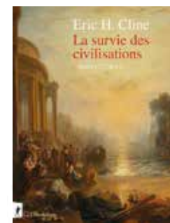
LA SURVIE DES CIVILISATIONS : APRÈS 1177 AV J.-C. Eric H. Cline | Documentaire