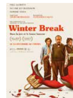
WINTER BREAK Alexander Payne | DVD