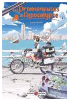
LES PROMENEUSES DE L'APOCALYPSE Sakae Saito | Manga