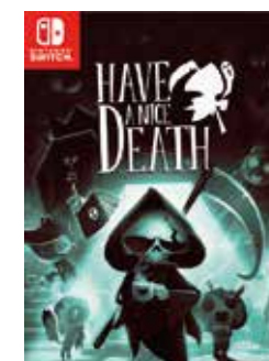
HAVE A NICE DEATH Magic Design Studios | Jeu vidéo